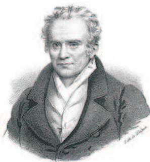
SLIKA 14. Gaspard Monge

Človek, ki je iznašel opisno geometrijo , se je rodil v Burgundiji in v Lyonu izšolal za učitelja fizike, uveljavil pa kot dober risar in inženir. Navdušil se je za francosko revolucijo in se ukvarjal s politiko. Leta 1792 je postal celo minister za mornarico in kolonije, leta 1793 pa član konventa in skupaj s prijateljem kemikom Claudom-Louisom Bertholletom odgovoren za tovarne smodnika in obrambo ogrožene republike.