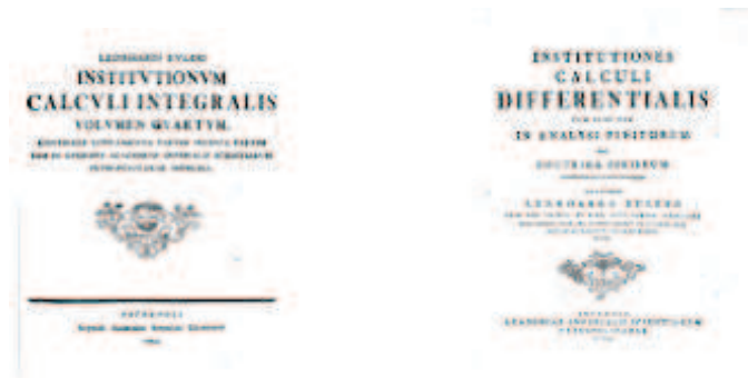
SLIKA 6. Eulerjevi razpravi o integralnem in diferencialnem računu

Eulerjeva slava temelji na njegovih knjigah. Najbolj znan učbenik matematike, v katerem je združil in poenostavil večji del dotedanjega matematičnega znanja, je Introductio in Analysin infinitorum iz leta 1748, temu je dodal knjigo o diferencialnem računu Institutiones calculi differentialis leta 1755 in tri volumne o integralnem računu v letih 1768-1774.