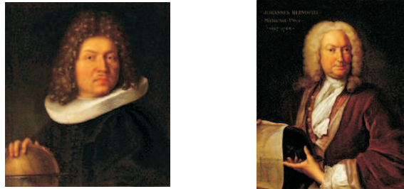
SLIKA 2. Jakob in Johann Bernoulli

Jakob in Johann Bernoulli , švicarska brata matematika, predstavnika ene najodličnejših družin v celotni zgodovini matematike, sta se učila iz Leibnizovih člankov, ki so izhajali v Acta eruditorum . Bila sta najbolj zvesta Leibnizova privrženca in sta veliko doprinesla k širjenju infinitezimalnega računa po Evropi. Od leta 1687 do smrti je starejši Jakob zasedal mesto profesorja matematike na univerzi v Baslu, mlajši Johann pa je leta 1697 postal profesor na univerzi v Groningenu na Nizozemskem. Leta 1705 je nasledil brata na univerzi v Baslu. Brata sta bila aktivna raziskovalca matematike in sta stalno izmenjavala svoje ideje z Leibnizom , drugimi sodobniki in med sabo, pogosto kot zagrizena nasprotnika oziroma tekmeča.