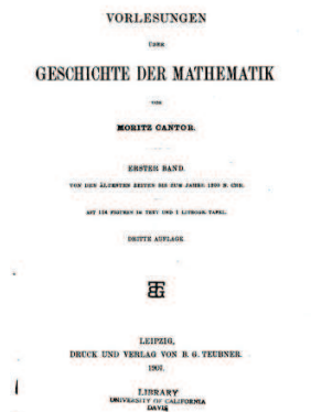
SLIKA 1. Naslovna stran prve knjige Zgodovine matematike Moritza Cantorja

Zaradi obilice materiala (števila ustvarjalcev matematike, njihovih člankov in rezultatov) ostane vsak pregled nadaljnjega dogajanja nujno le nepopolna skica. Če je nemški zgodovinar matematike Moritz Cantor (1829-1920) popisal njeno zgodovino do konca 18. stoletja v štirih debelih knjigah s po 1000 strani, bi samo za 19. stoletje potrebovali ob enaki ločljivosti 14 dodatnih knjig enakega obsega in podobno samo za prvo polovico 20. stoletja. Število mednarodnih časopisov, ki so posvečeni izključno matematiki, se je enormno povečalo. Res pa je, da lahko samo zelo majhen del objavljenih člankov prebere še kdo razen peščica specialistov.