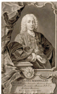
SLIKA 4. Daniel Bernoulli

Daniel Bernoulli (1700-1782) je bil najslavnejši od Johannovih sinov. Potem ko je sedem let preživel v Sankt Peterburgu, se je vrnil v Basel. V verjetnosti je razvil koncept moralnega pričakovanja , v svoji Hidrodinamiki iz leta 1738 pa je postavil osnove fizikalne teorije tekočin ( Bernoullijeva enačba ). Pisal je o plimi, kinetični teoriji plinov, študiral nihajočo struno in kot eden prvih raziskoval parcialne diferencialne enačbe.