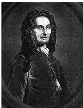
SLIKA 9. Abraham de Moivre

Med ostalimi matematiki tega časa omenimo Abrahama De Moivre (1667-1754), Francoza, ki je skoraj vse svoje življenje preživel v Angliji, znanega po svoji Doktrini verjetnosti in kot začetnika actuarske matematike. Ukvarjal se je tudi z analizo in trigonometrijo, prvi je napisal verjetnostni integral \int_0^\infty e^{-x^2} dx = \sqrt{\pi}/2 , iznašel formulo n! \approx (2\pi n)^{1/2} e^{-n} n^n , ki nosi ime po Jamesu Stirlingu (1692-1770), in nas naučil, da je (\cos x + i \sin x)^n = \cos nx + i \sin nx .