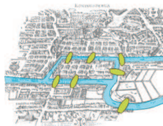
SLIKA 7. Königsberski mostovi čez reko Pregel

V teh knjigah je uvedel jasno in moderno notacijo (npr. f(x) za funkcijo, e za osnovo naravnih logaritmov, i za imaginarno enoto, znak \Sigma za vsoto itd.). To so obenem prve knjige, ki so tudi na videz take kot sodobni matematični teksti. Uvedel je znamenito formulo e^{ix} = \cos x + i \sin x s posledico e^{i\pi} + 1 = 0 in 'čudno' zvezo i^i = e^{-\pi/2} . V geometriji trikotnika je znana Eulerjeva premica , v zvezi s konveksnimi poliedri Eulerjeva formula V - E + F = 2 , v teoriji števil Eulerjeva funkcija \phi , pa Eulerjev izrek (posplošitev Fermatovega). Večino trditev, ki jih je navedel Fermat brez dokaza, je dokazal ravno Euler, npr. dejstvo, da se da praštevilo oblike p = 4k + 1 na en sam način zapisati kot vsota dveh kvadratov, pa mali Fermatov izrek (glej vajo 11). Do Eulerja so poznali le tri pare prijateljskih števil, on je odkril skoraj 60 novih parov. Zavrnil je domnevo o Fermatovih praštevilih (vaja 12). Pripisujejo mu definicijo funkcij beta in gama, čeprav jih je poznal že Wallis. Pri diferencialnih enačbah je uvedel integracijski faktor, znana je Eulerjeva diferencialna enačba , napisal je osnovne formule variacijskega računa. Velja tudi za začetnika teorije particij in v kombinatoriki za predhodnika teorije grafov (Königsberski mostovi, premikanje šahovskega konja), konstruiral je magične kvadrate.