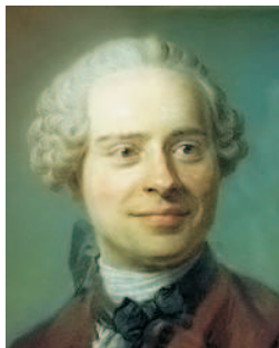
SLIKA 11. Jean le Rond d'Alembert

Johanna Heinricha Lamberta (1728-1777) smo že omenili v zvezi z neevklidsko geometrijo. Rojen je bil v Mulhousu v Alzaciji, takrat v Švici, v precejšnji meri samouk, postal pa je kvaliteten matematik z občutkom za rigoroznost.