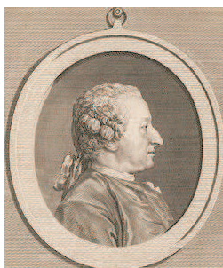
SLIKA 10. Alexis Claude Clairaut

Bil je Parižan, nekoliko mlajši od Eulerja in čudežni otrok, ki je že kot trinajstletnik napisal razpravo o krivuljah tretjega reda, kasneje pa še razpravo o prostorskih krivuljah. To mu je zagotovilo mesto v Francoski akademiji znanosti pri 18. letih, kar ni bilo niti običajno niti po pravilih.