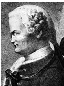
SLIKA 12. Johann Heinrich Lambert

Prvi je leta 1761 korektno dokazal, da je število \pi iracionalno, in sicer tako, da je najprej ugotovil, da za neničelne racionalne argumente x vrednost \operatorname{tg} x ne more biti racionalna, nato je vstavil x = \pi/4 . Prvi je tudi vpeljal in raziskal hiperbolične funkcije. Ukvarjal se je s petim Evklidovim postulatoma o vzporednicah ( Lambertov štirikotnik ); leta 1766 je svoja tovrstna raziskovanja opisal v delu Die Theorie der Parallellinien . Pisal je še o opisni geometriji, računal orbite kometov, uporabljal projekcijo pri kartiranju itd.