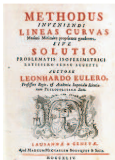
SLIKA 8. Eulerjeva knjiga o izoperimetričnih problemih

Njegovo celokupno delo, Opera Omnia , 73 zvezkov zbranih člankov in knjig, skupaj jih je 886, napisanih v latinščini, francoščini in nemščini, je opus, ki ga ni še nihče presegel. Ocenjujejo, da je tretjino vseh matematičnih del v drugi polovici 18. stoletja napisal Euler. Pisal je tako naglo, da ga založniki niso mogli dohajati, izdajanje njegovih del je trajalo še 47 let po njegovi smrti. Na prvem mednarodnem matematičnem kongresu leta 1897 v Zürichu so Švicarji napovedali in v začetku 20. stoletja tudi začeli urejati in izdajati njegova zbrana dela. To je projekt, ki ob pomoči različnih akademij (Berlinske, Sankt-peterburške) in drugih ustanov še vedno traja. Skupaj so natisnili že čez 25.000 strani Eulerjevih matematičnih besedil. Samo o analizi je izdanih 18 debelih zvezkov s skoraj 9000 stranmi (tri knjige in na desetine člankov od diferencialnih enačb preko neskončnih vrst do eliptičnih integralov).